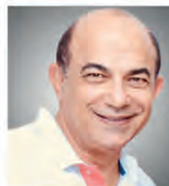
Pr. SHAWKI O